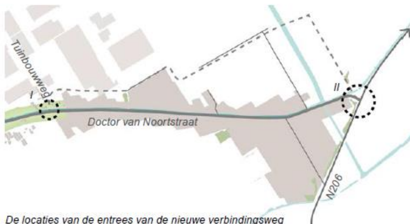
De locaties van de entrees van de nieuwe verbindingsweg