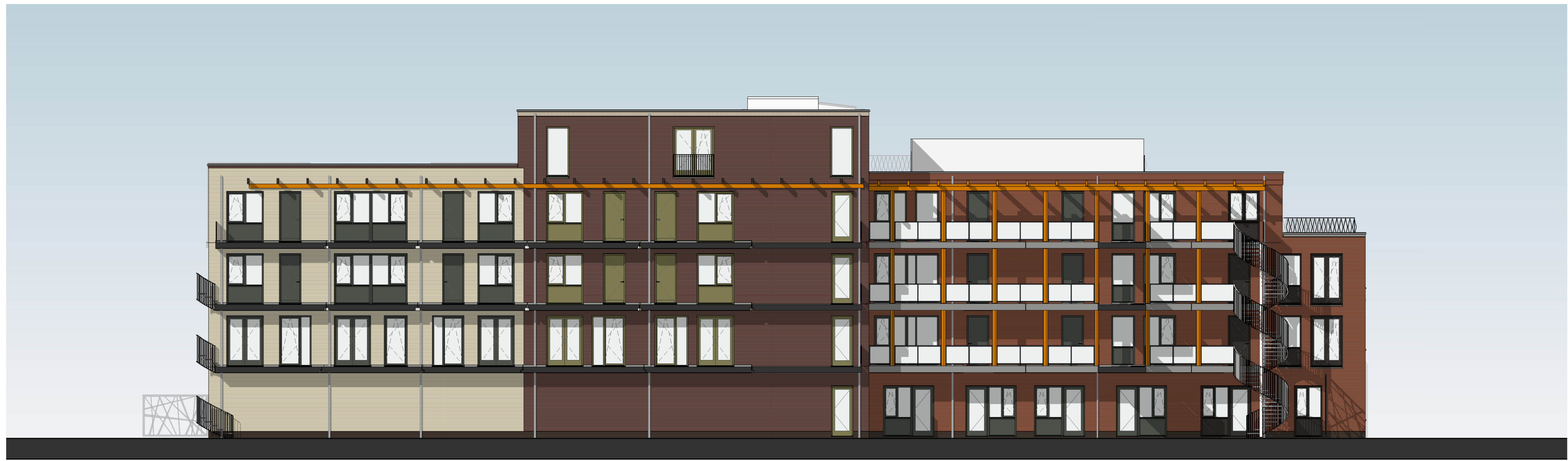
fragment binnengevel Damlaan