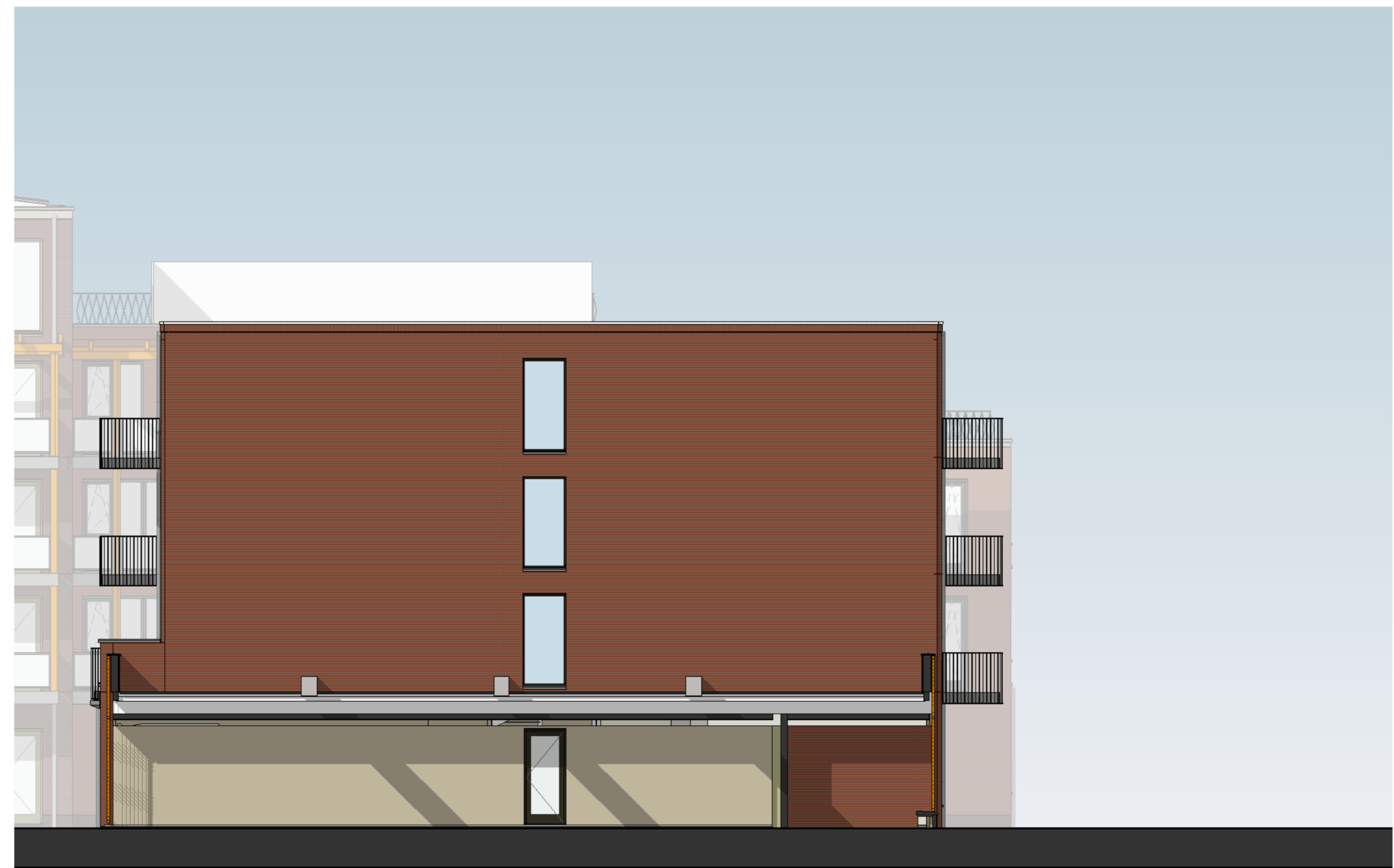
fragment Nummercentrale Rijnlandstraat zijde

Van Rijn Bouw Katwijk Valkenburgweg 62, 2223 KE Katwijk (071) 401 60 41 info@vrbouw.nl www.vanrijnbouw.nl