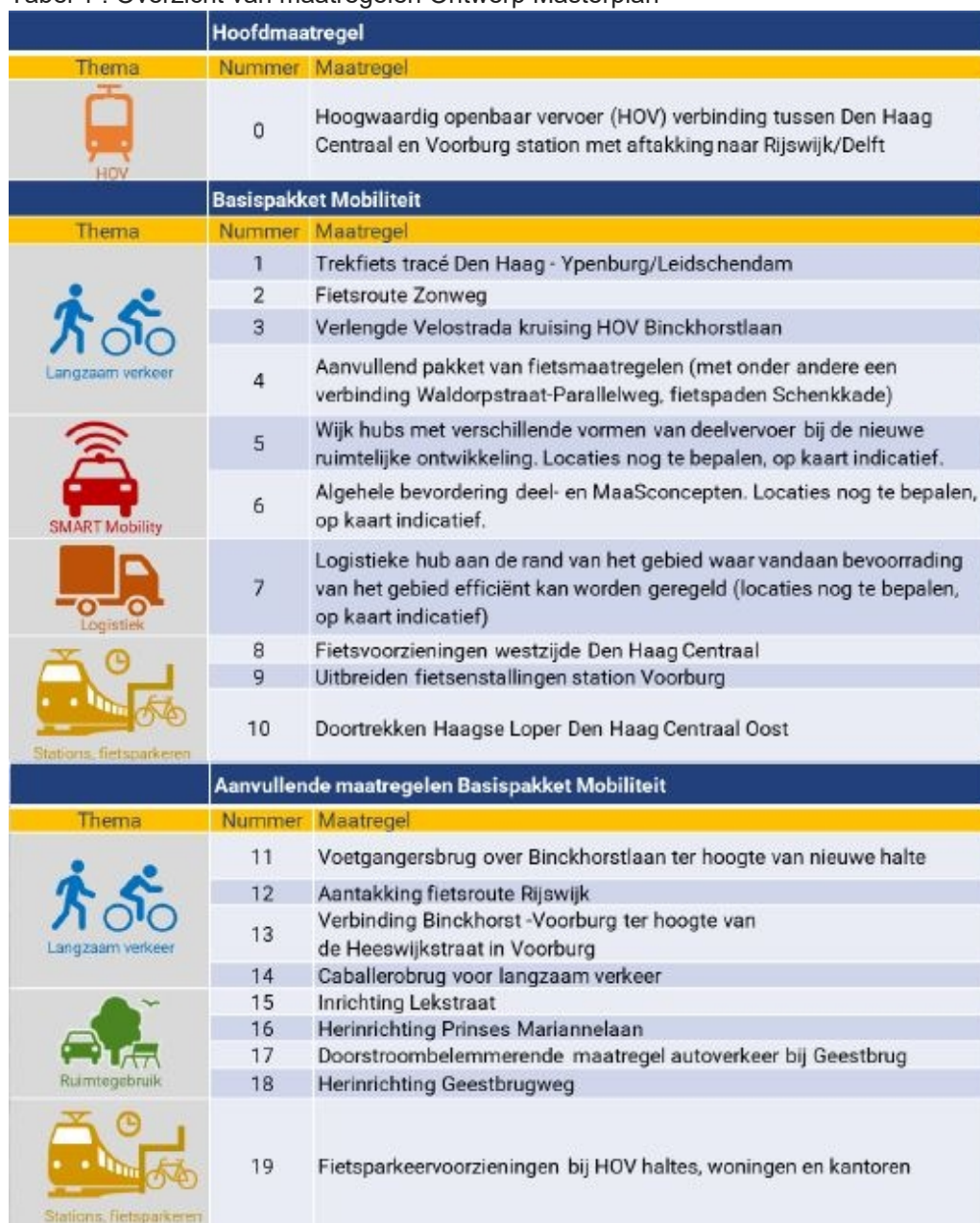
Tabel 1 : Overzicht van maatregelen Ontwerp Masterplan